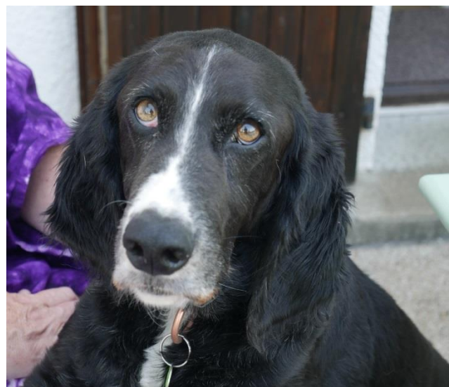
Oslo, type basset env 25kgs, castré

Dolly et Oslo ont 9 ans tous les deux, ils sont à l'association depuis plus d'un an déjà et nous souhaitons de tout cœur qu'ils puissent enfin trouver une nouvelle famille. Ils ont tous les deux un caractère en or, ils sont sociables et s'entendent avec tout le monde. Ce sont des amours de chiens, très sympas et en pleine forme !